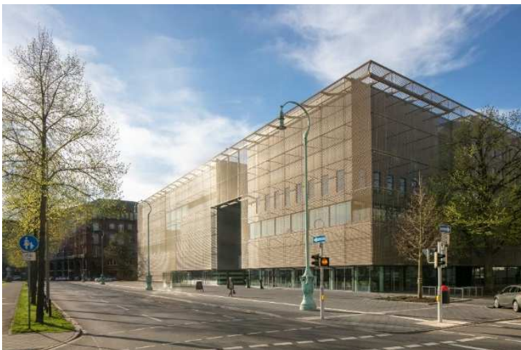
The new building of the Kunsthalle Mannheim